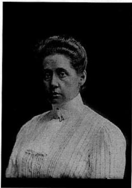
СОФИЯ ВЛАДИМИРОВНА ПАНИНА